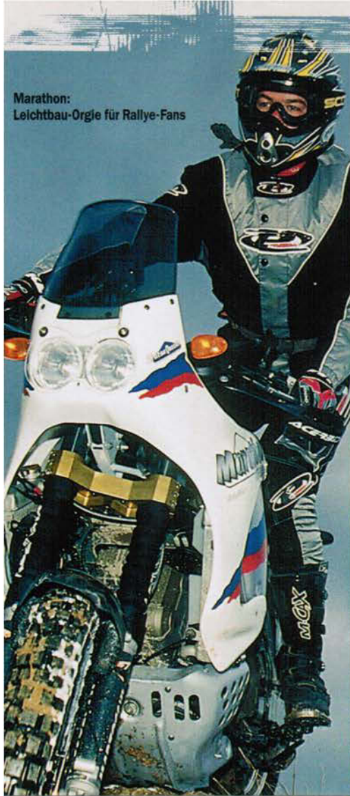
Marathon: Leichtbau-Orgie für Rallye-Fans