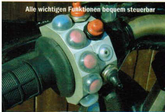
Alle wichtigen Funktionen bequem steuerbar

Rallye Forte XRV 840 mit Motor-Kit 22.700,- Euro Rallye Forte XRV 750 mit Serie optimiert 20.300,- Euro Rallye Forte XRV 750 mit Motor-Kit 1 21.300,- Euro Rallye Forte XRV 750 mit Serie Standard 19.500,- Euro