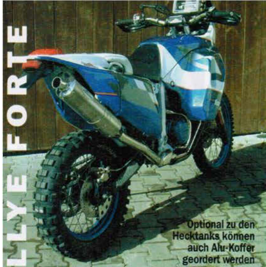
Optional zu den Hecktanks können auch Alu-Koffer geordert werden

...ung vorgeben bis das Tempo endlich erhöht werden kann. Etwa ab Schrittgeschwindigkeit stabilisiert sich der Bolide und steuert sauber geradeaus. Auch hier bewährt sich das edle Fahrwerk. Löcher, Spurrillen und kleinere Buckel bekommen wir kaum zu spüren. Bei höheren Geschwindigkeiten schlucken die Dämpfer sogar noch mehr. Wie schon auf der Autobahn festgestellt, gilt auch hier, je schneller umso besser. Die Rallye Forte 840 ist wahrhaftig ein richtiges wettbewerbstaugliches Rallye-Motorrad. Enduropassagen sind zur Not auch zu meistern, doch Kilometer fressen auf fast jedem Untergrund ist die Lieblingsdisziplin der Königin. Nachdem Stephan Jaspers die komplette Enduro-Palette von Honda durchgearbeitet hat, entsteht derzeit ein neues ungewöhnliches Motorrad. Ungewöhnlich vor allem deshalb, weil es auf der Basis einer anderen Marke entsteht, die sozusagen hier einen Heimvorteil genießt. Wir werden dran bleiben und auch darüber berichten.