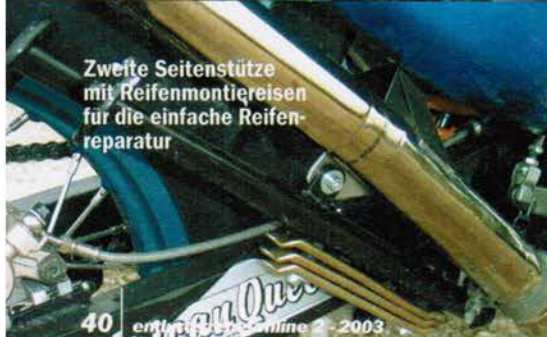
Zweite Seitenstütze mit Reifenmontiereseisen für die einfache Reifenreparatur