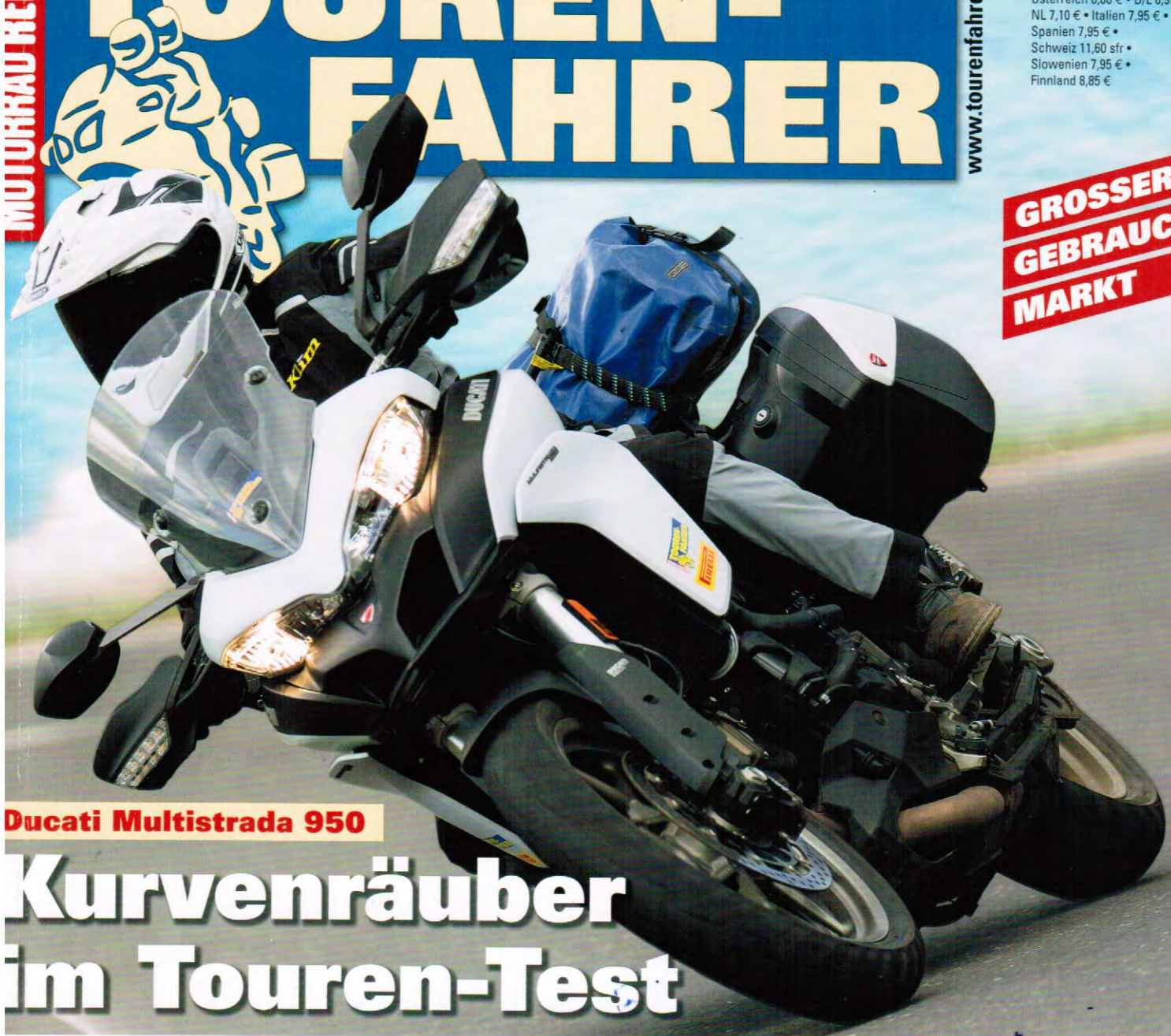
Ducati Multistrada 950