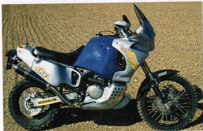
Getopptes Fahrwerk und Sprit-Kapazität ohne Ende: wüste RD 07.

Rallye-Teilnahme, Fernreise, Mehrleistung, neue Optik? Was auch immer auf der Wunschliste steht, bei African Queens wird der Twin-Fan fündig werden. Inhaber Stephan Jaspers hat für sämtliche Modellreihen Front- und Hecktanks in allen erdenklichen Größen im Programm, strickt neue GfK- oder Carbon-Verkleidungen und holt alles, was die Rallye-begeisterten Italiener für die Twin anfertigen, nach Deutschland.