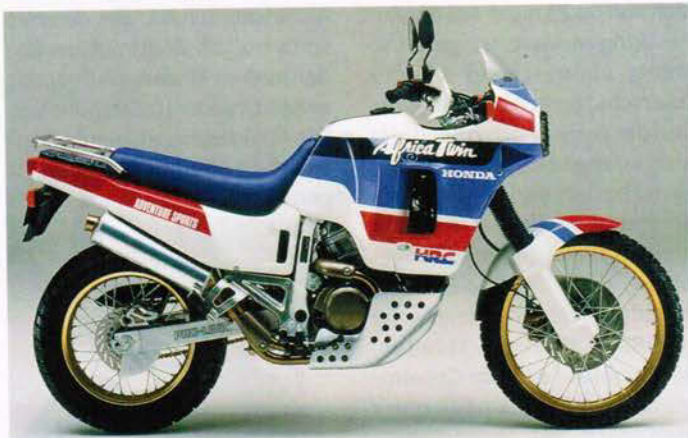
Erste RD 03: Ein Hauch Paris-Dakar weht durch die Honda-Showrooms.