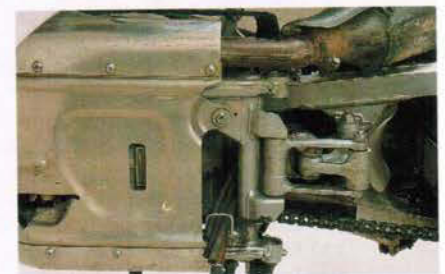
Der V-Motor der Africa Twin ist ein Ausbund an Zuverlässigkeit, eine solide Alu-Platte schützt die empfindliche Unterseite des Triebwerks.

und ein ergonomisch korrekt geformter 23-Liter-Tank, der für Reichweiten zwischen drei- und vierhundert Kilometern sorgt, sofern nicht reine Dünenpassagen auf dem Programm stehen.