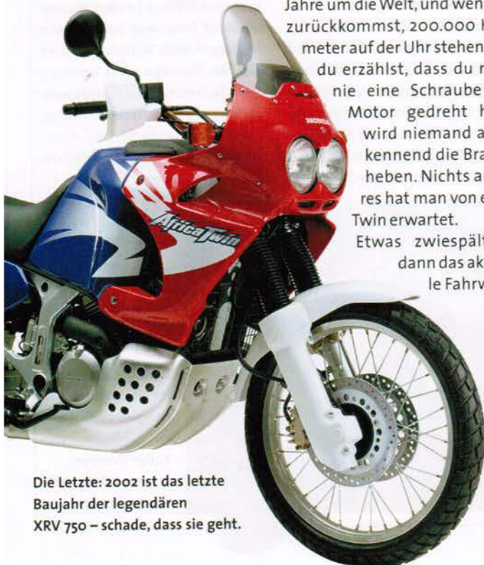
Die Letzte: 2002 ist das letzte Baujahr der legendären XR750 – schade, dass sie geht.