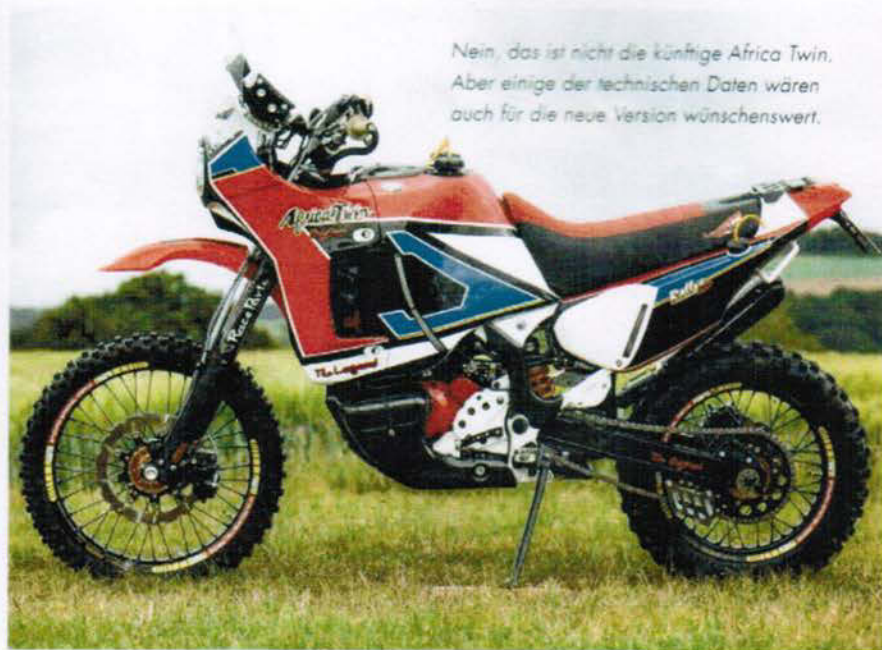
Nein, das ist nicht die künftige Africa Twin. Aber einige der technischen Daten wären auch für die neue Version wünschenswert.

Legend Rallye 890« für eine Probefahrt vorbei. Und er strahlt. Bei der Vorstellung in Dortmund hatte diese V2-Enduro noch keinen Prüfstand bestiegen und selbst Twin-Experte Jaspers war gespannt auf die Leistungsfähigkeit. Das Ergebnis: 85 PS an der Kurbelwelle, ein zufriedenstellender Wert. Erreicht wurde die höhere Effizienz durch die Hubraum-Erweiterung von 742 ccm auf 890 ccm und durch andere Nockenwellen.