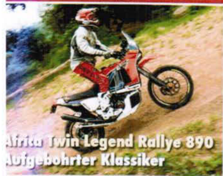
Afrita Twin Legend Rallye 890 Aufgebohrter Klassiker