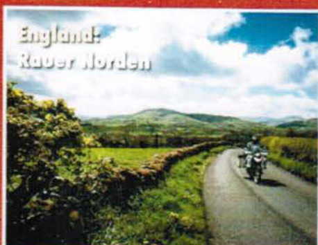
England: Rauber Norden

GESUNDHEIT UNTERWEGS Was hilft gegen Malaria & Co.