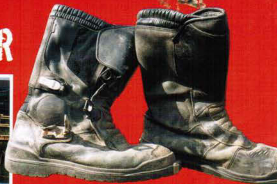
WER TRÄGT WAS? Die Reise-Stiefel der Profis