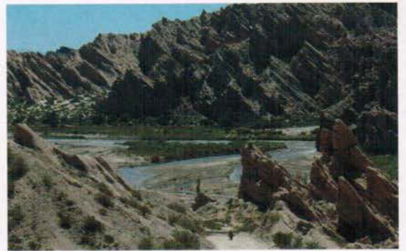
In den Canyons Nordargentiniens bei Salta

Im kommenden Jahr wird AfricanQueens für deutsche Fahrer die komplette Organisation (Transport, Service, Mechaniker) übernehmen. Ein ausführlicher Test der Africa Twin Legend Rallye 890 steht in der Juli/August-Ausgabe 4/15 von MotorradABENTEUER.