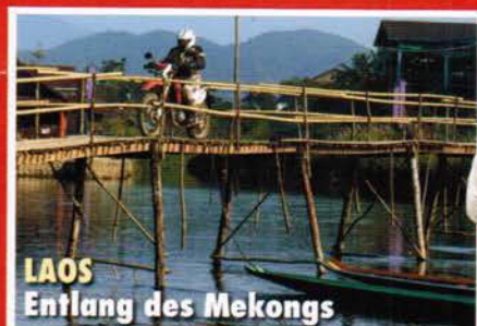
LAOS Entlang des Mekongs